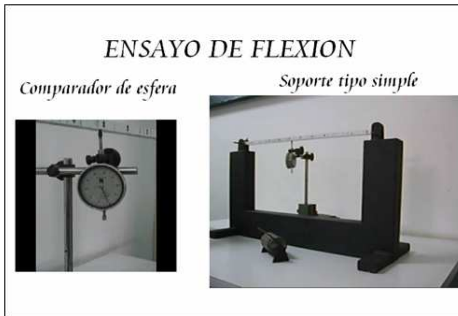
Figura 3: Video explicativo del ensayo de flexión

Cuando el alumno llega al punto procedimiento del ensayo ya posee la información necesaria para realizar el ensayo; en este punto se facilita al estudiante videos narrados donde se indica como hacer el montaje del ensayo. También se disponen otros videos para describir y explicar la prueba, en el mismo video se muestra el o los elementos que registran información. Esto acerca el estudiante a la realidad del ensayo.