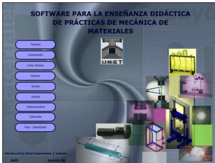
Figura 1: Menú de entrada del software

La figura 1 muestra el menú de entrada del software. En este menú el usuario tiene acceso a todas las prácticas desarrolladas. Adicionalmente, se han agregado tres botones, uno de estos provee la historia de los hombres que hicieron descubrimientos en el campo de la mecánica de los materiales y que hoy llevan su nombre, los autores al igual que Godoy (2004) comparten la idea que esto genera un efecto positivo sobre los estudiantes, quienes podrán reflexionar sobre la manera y condiciones de vida en la que estos investigadores introdujeron nuevos puntos de vista a la ingeniería.